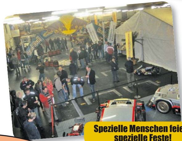
Spezielle Menschen feiern spezielle Feste!