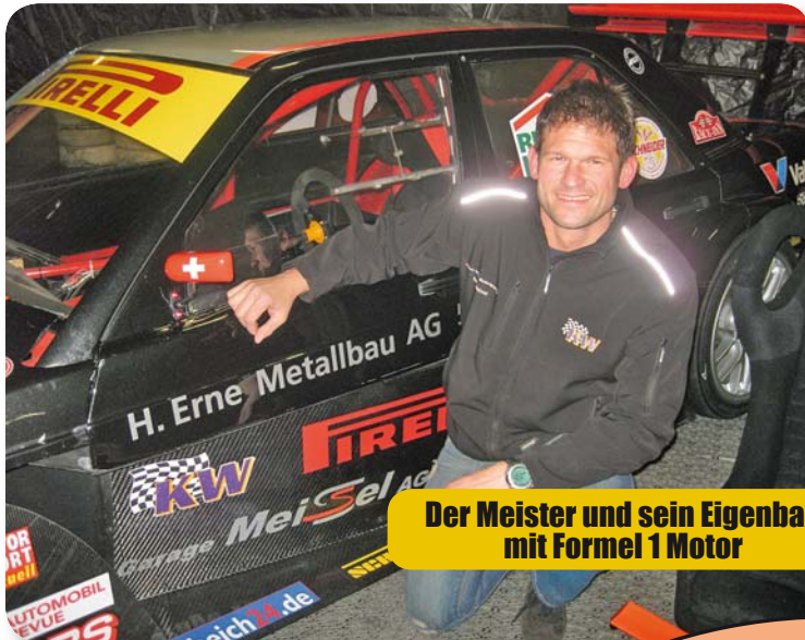
Der Meister und sein Eigenbau mit Formel 1 Motor