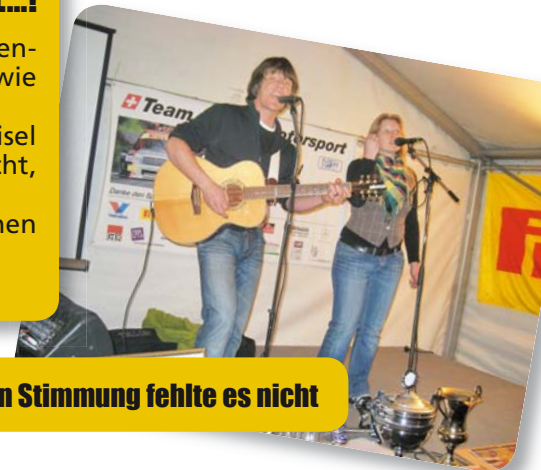
Auch an Stimmung fehlte es nicht

Mehr Infos finden Sie unter www.meisel-motorsport.ch